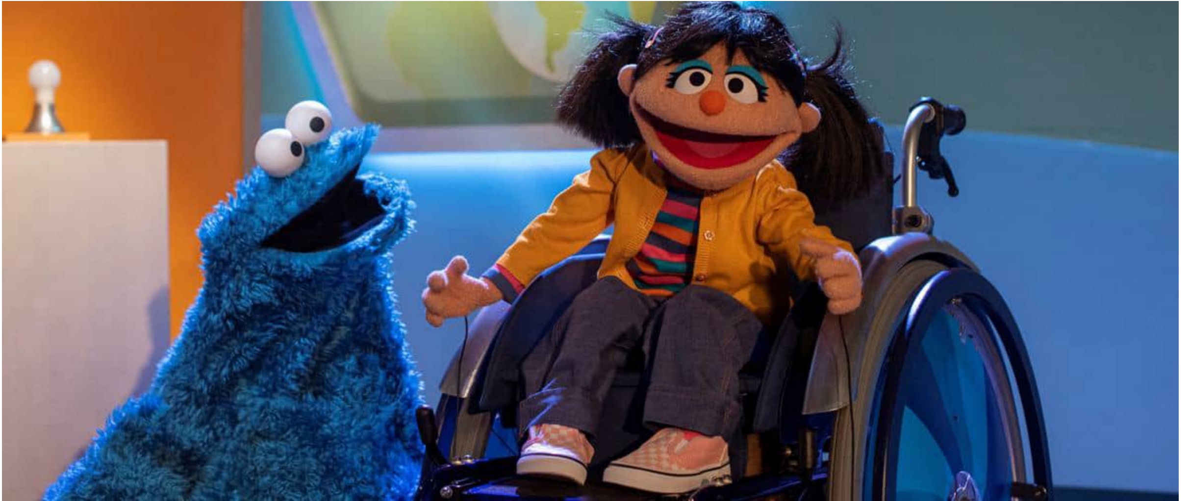
Puppe im Rollstuhl zieht in die "Sesamstraße" - DWDL.de