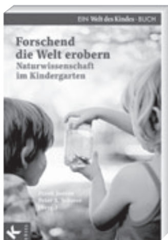
»Forschend die Welt erobern« 17,95 €