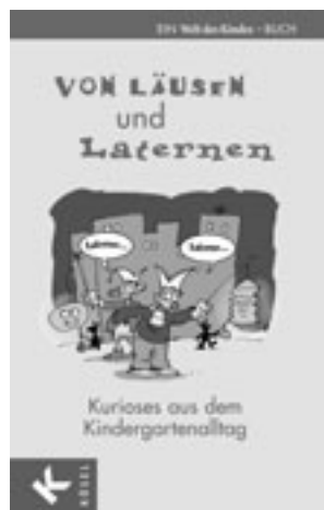
»Von Läusen und Laternen« 9,95 €